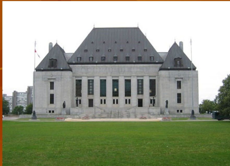
Cour suprême du Canada à Ottawa